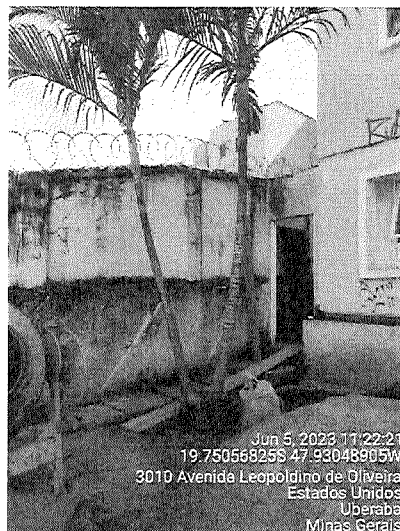
Figura 1 – Areca-bambu.

Diante do exposto, palmeiras não são passíveis de autorização, todavia, considerando a Lei nº 9.605/1998 em seu artigo 49, estes Técnicos recomendam a supressão do espécime, considerando o conflito com a implantação das vagas de estacionamento.